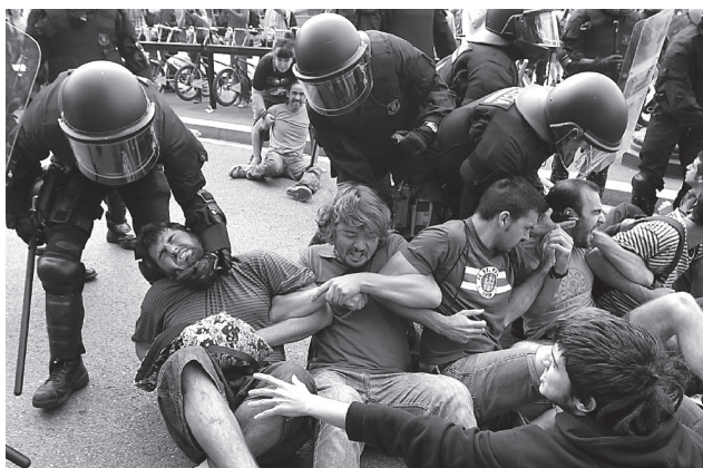
Седеће демонстрације 637

Посебно су интересантне такозване „седеће демонстрације“, као посебан вид индиректног агресивног понашања. Код оваквих демонстрација, постижу се одређени политички циљеви, али често грађани који немају или не препознају интерес да подрже демонстранте, трпе, јер су на тај начин спречени да на време стигну и завршавају своје послове. „Мирни“ демонстранти циљано одабирају место за седење које ће привући велику пажњу грађана, ако ни због чега другог онда због тога што је настао застој у саобраћају. Значи, „седеће демонстрације“ само имају привид пасивности, због чега су у многим европским метрополама проглашене за насилне, јер демонстранти злоупотребљавају своје право мирног окупљања тиме што својим телима спречавају друге грађане да слободно обављају своје потребе. Иначе, сама техника борбе против „седећих демонстрација“ је крајње једноставна. Демонстранти се одводе са лица места уз минималну примену силе и спречавање посматрача да им се придруже. Демонстранте никако не треба односити са места држећи их за руке и ноге, јер те сцене могу изазвати симпатије у корист демонстраната. Због тога, најбољи начин је примена уобичајених полицијских захвата привођења ухапшеника. 636