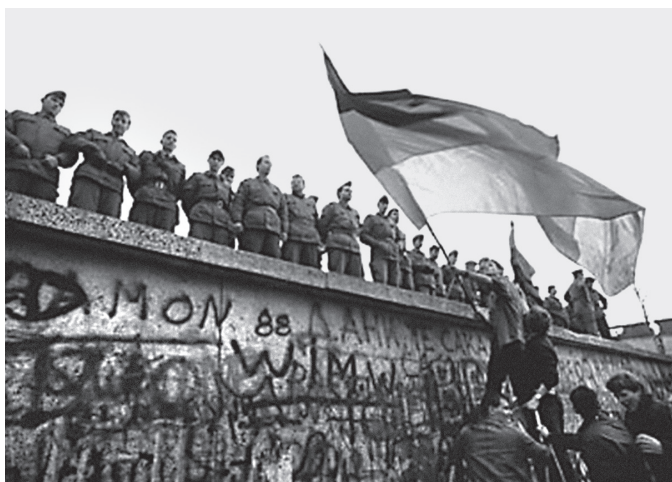
Берлински зид 657

Савремене политичке преврате често инспиришу групе које се могу квалификовати чак и као маргиналне, али се оне од стране политичких фактора или специјалних служби тако инструишу да примењују ефикасне методе политичких преврата без крви или са врло мало сукоба. Ти сукоби се углавном свде на деловање различитих полицијских одреда и специјалних јединица, које првенствено делују физичком силом, а понекад и ватреним оружјем. У овим појавама наговештава се смена система вредности, често и смена свеукупних односа, али и положаја појединих снага у тим односима.