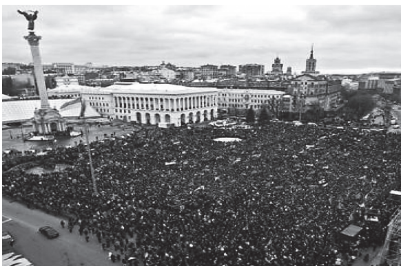
Револуционарни догађаји у Украјини 2004. године 71

на изборна комисија издала је званично саопштење да је победио Јанукович. Међутим, имајући у виду геополитички положај Украјине, било је јасно да је због мале процентуалне разлике у укупном броју гласова на помолу дубока постизборна криза, кроз коју ће се преламати интереси најугицајнијих земаља. Запад је оштро критиковао украјински изборни процес, сматрајући да су избори покрадени, те да је у другом кругу победио Јушченко, чему у прилог иде и неколико званичних изјава тадашњег председника Сједињених Држава. С обзиром на то да Јушченков изборни тим и његови инострани консултанци нису били сигурни у његову победу у случају евентуалног понављања другог круга председничких избора, по моделу обојених револуција организоване су масовне демонстрације. Те демонстрације су биле добро осмишљене и логистички подржане, тако да су могле да се одрже све до јануара 2005. године, када је постизборна криза постигла врхунац и остварила се у обојеној револуцији.