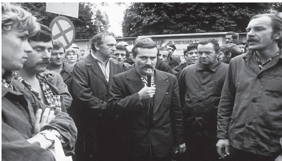
Лех Валенса на челу покрета „Солидарност“ 397

У том смислу, веома је распрострањено мишљење да се само уз подршку и помоћ из иностранства може збацити тоталитарни режим, што је донекле и тачно. Због тога, разумљиво је што многи потлачени гаје наду да ће им слободу од репресивног режима донети други. Међутим, такво уздање у спољни фактор може бити потпуно погрешно, јер се подршци из иностранства не може у потпуности веровати. С тим у вези, са аспекта превратничких структура, постоји неколико веома битних чињеница у вези са разматрањем могућности за ослањање на подршку из иностранства: