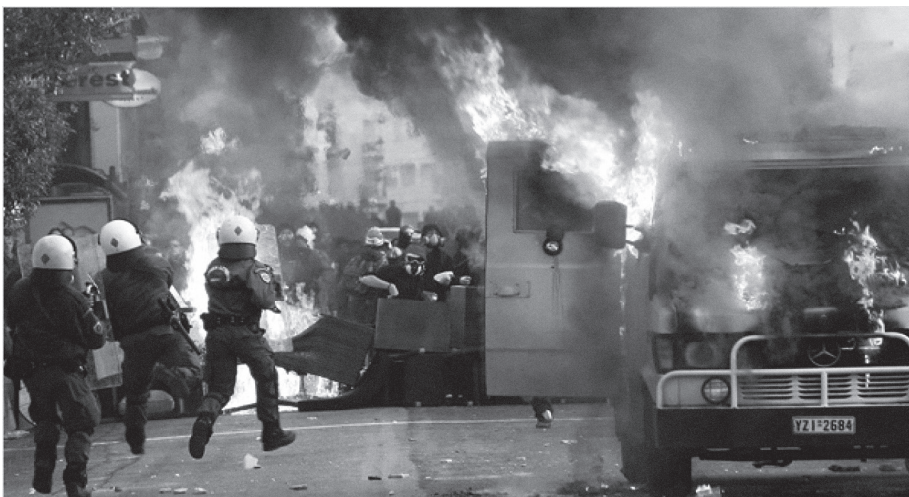
Насилне демонстрације са елементима грађанских нереда 643

Неизоставно је и напоменути, да није реткост да су део лица из те категорије конзументи наркотика и других психоактивних супстанци. Често се баве и илегалном дистрибуцијом и кријумчарењем наркотика, као и другим насилничким облицима криминала, попут убистава, изнуда, уцена и томе слично. Због своје хомогености и добре организованости, која почива на страху и чврстој дисциплини, за веома кратак временски период могу да се мобилишу и изазиву грађански нереди ширих размера. Појединац свој статус у организацији најчешће стиче на основу бруталности у разрачунавању са супарничким групама, као и на основу учествовања у сукобима са органима реда. По правилу, вође готово увек прате актуелну политичку ситуацију у земљи и користе сваки могући тренутак за афирмацију или критиковање одређених политичких ставова или друштвених вредности. Увек настоје да су „близу“ носилаца власти, првенствено се руководећи личним интересима, а ређе интересима групе којој припадају.