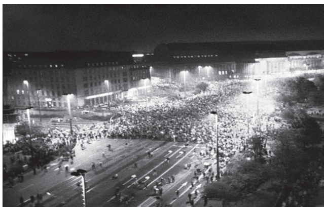
Революционарни догађаји у Источној Немачкој 1989. године 54

Октобра 1989. године Ерих Хонекер је поднео оставку и дужност шефа Политбироа предао Егону Кренцу, који је само након нешто више од месец дана, под притиском опозиције, био принуђен да поднесе колективну оставку са другим члановима Политбироа. То је резултирало хапшењем и процесуирањем бројних политичара, официра и припадника специјалних служби, због чега се стекао утисак да су нове немачке власти отишле најдаље у обрачуну са најзначајнијим полугама некадашњег комунистичког режима. Истовремено, уједињење „две Немачке” уследило је октобра 1990. године и представљало је процес који је био мукотрпан и сложен, јер је, поред осталог, постојао отпор становништва некадашње Западне Немачке томе да се бивша источнонемачка популација интегрише у јединствену друштвену заједницу.