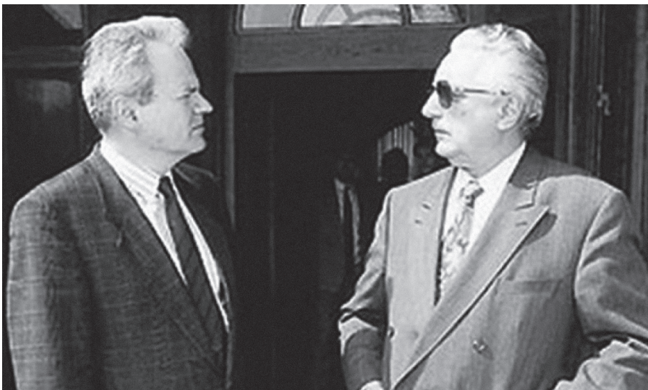
Слободан Милошевић, некадашњи председник Србије и Фрањо Туђман, бивши председник Хрватске 689

паралелно информисање из војске и упоредо са тим извршио је јачање Службе државне безбедности Србије. Као национални вођа у успону, започео је директне преговоре са другим политичким лидерима о даљој будућности Југославије, пре свега са хрватским председником Фрањом Туђманом. Исход је познат.