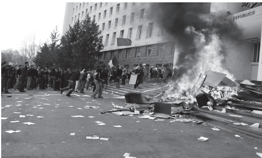
Революционарни догађаји у Молдавији 2005. године 77

У енергичној акцији молдавске полиције, након неколико дана успостављен је правни поредак у земљи, а преко 200 демонстраната је ухапшено и кривичноправно процесуирано. У међувремену, немири су попримили међународни карактер, а молдавски председник Владимир Вороњин јавно је оптужио Румунију да је покушала да изведе преврат у Молдавији, истовремено прогласивши тадашњег румунског амбасадора у Кишињеву за persona non grata . Уставни суд Молдавије наложио је поновно пребројавање гласова и проверу бирачких спискова, при чему су реакције Европске уније на догађаје у Молдавији биле суздржане. Најоштрије су реаговали поједини руски политичари, пре свих лидер комунистичке партије ГенADIЈ Зјуганов, који је нагласио да иза демонстраната стоје стране обавештајне службе, које су организовале револуције у Грузији и Украјини. Међутим, западни аналитичари сматрају да су, поред неједнаких услова у предизборној трци, главни разлози масовних протеста у Молдавији били сублимирани у незадовољству бирача корумпираним властима и економском ситуацијом, а додатну фрустрацију Молдаваца, по њиховој процени, изазвао је наводни успех Румуније у европским и евроатлантским интегративним процесима. 78