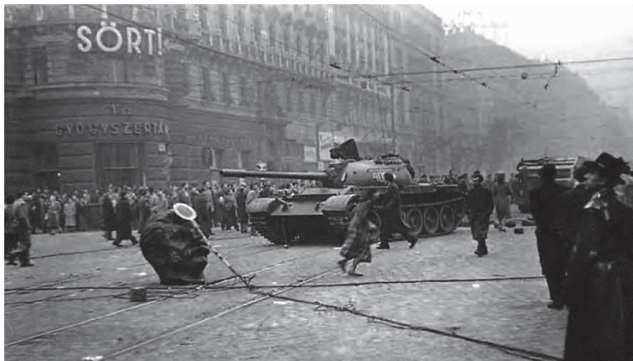
Сложени политичко-безбедносни догађаји у НР Мађарској из 1956. године 519

Сматрамо да су совјетске војне интервенције из 1956. године у Мађарској и 1968. године у Чехословачкој, сликовити примери улоге овог вида војно-политичког интервенционизма у револуционарним процесима. Те тадашње контрареволуције или посматрано са данашњег аспекта револуције, угушене су у крви, и као такве представљале су реакцију Варшавског блока на све заоштреније односе са Северноатлантском алијансом.