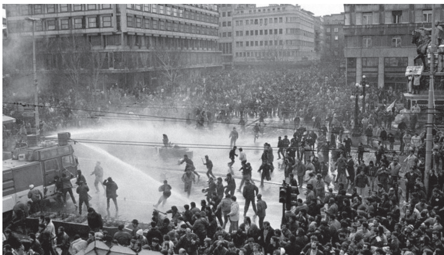
Демонстрације од деветог марта 1991. године 685

Други догађај односио се на 12. март, дан када је одржана чувена седница врховне команде оружаних снага. Ова седница је била веома важна, може се рећи и од пресудног значаја за даљи развој југословенске кризе. Седница је у самом старту имала одређену специфичност, а то је да је сазвана јавно, посредством телевизијског обраћања. Тада је настала паника међу словеначким, хрватским и македонским републичким руководством, јер су процењивала да ће врх ЈНА искористити присуство свих републичких представника, извршити њихову изолацију и реализовати војни удар. Наводно, из тих разлога на поменути седницу није допутовао словеначки представник Јанез Дрновшек. По доласку у Београд, чланови Председништва су се састали испред централне зграде Савезног извршног већа, одакле су војним аутобусом превезени до издвојеног командног места у Ужичкој улици у Београду. Ту су представници ЈНА изнели да је стање у држави драматично и затражили увођење ванредног стања, али Председништво је гласало против. Конкретно, Председништво је гласало следећим редоследом: Костић из Црне Горе – да, Тупурковски из Македоније – не, Месић из Хрватске – не, Јовић из Србије – да, Сапунџија са КиМ – да, Богић Богићевић из БиХ – уздржан. То гласање је дефинитивно обележио Богић Богићевић,