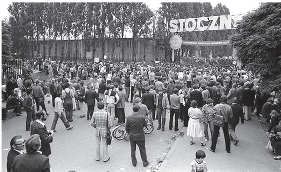
Штрајк у гдањском бродоградилшту 632

Органи безбедности својим оперативним ангажовањем морају покривати неуралгичне тачке на којима може доћи до појаве нелегалних штрајкова на подручју целокупне државе. То не подразумева да својим деловањем треба да се мешају у пословну политику неке компаније, предузећа или фабрике, већ да професионалним и непристрасним наступом, идентификују сва потенцијална жаришта и ризике по овом основу.