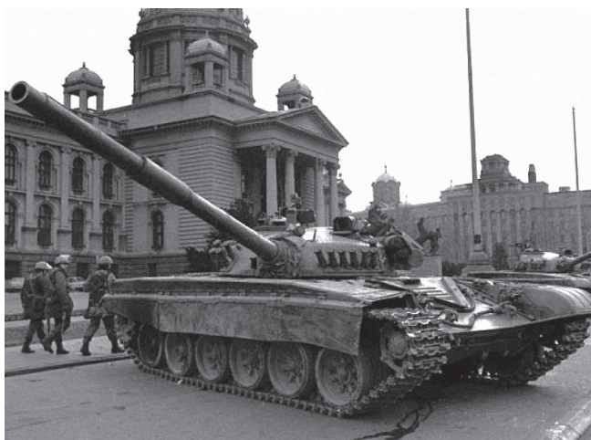
Сложени политичко-безбедносни догађаји у Београду из марта месеца 1991. године 683

Даљи догађаји су се ређали као на филмској траци. Уследила су два веома важна догађаја која су се одиграла у првој половини марта месеца 1991. године. Први се односио на опозициони митинг 9. марта у Београду, који је услед сукоба демонстраната са полицијом попримио облик нерета ширих размера. Тог дана у вечерњим часовима интервенисала је и ЈНА, тако што је без употребе силе прошла кроз центар града са оклопно механизованим јединицама. Наредбу о непосредном укључивању војске у сузбијање демонстрација издао је Борисав Јовић у својству председника Председништва СФРЈ, а на основу консултација са другим члановима Председништва. Описујући те драматичне догађаје Јовић наводи: „Налазим се на викенду у Никшићу. Зове ме Слободан Милошевић и тражи интервенцију војске. Разговарам са Вељком Кадиевићем. Он се двоуми – да ли је неопходно и како ће то политички бити прихваћено, али се не противи, само сматра да треба да осигурам одлуку Председништва... Слоба и Вељко ме зову веома узнемирени. Вељко каже да сада демонстрирају пред Генералштабом и хоће да провале унутра. Консултујем телефоном све чланове Председништва које сам могао добити (све изузев Месића и Дрновшека). Дајем Вељку налог да изведе војску на улице и да запоседне простор испред свих угрожених државних институција“. 682